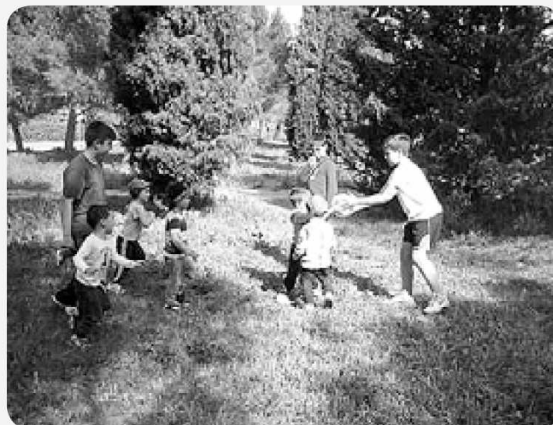
Jornada de convivencia en el cerro de San Jorge. S.E.